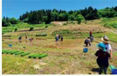
春の田植えの様子

ふるさと友好都市・新潟県長岡市川口地域の木沢地区の「木沢棚田保全連絡協議会」が実施する棚田オーナー事業を募集します。