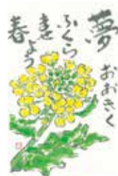
「狛江・絵手紙サポーター」からの作品