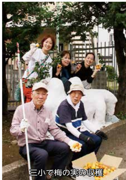
三小で梅の実の収穫

5日には会員5人が脚立に乗って梅をもいだほか、落ちた実を拾って手伝う児童もいた。この日は約10kgを収穫、5kgを梅干し、3.3kgを梅シロップに加工、残りは冷凍保存して梅みそなどにするという。このほか、会員に呼びかけ、個人宅で利用されていない梅